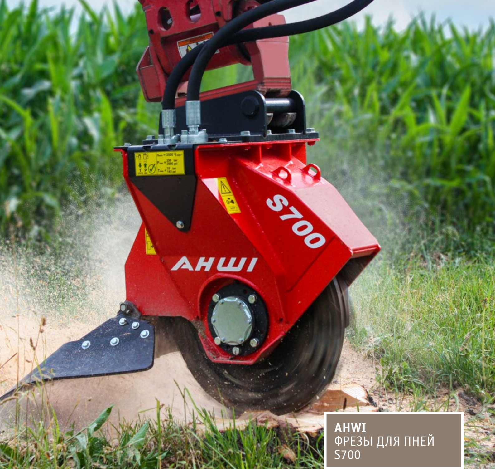
АНШІ ФРЕЗЫ ДЛЯ ПНЕЙ S700